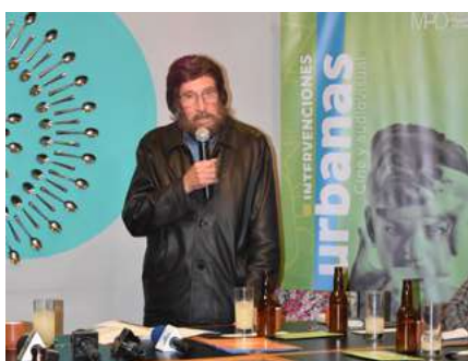
ÁLVARO GARCÍA LINERA Vicepresidente del Estado Plurinacional de Bolivia.

Los proyectos ganadores fueron seleccionados por un comité evaluador conformado por productores de cine extranjero que llegaron desde Argentina, México, Francia y la participación boliviana de la Agencia del Desarrollo del Cine y Audiovisuales Bolivianos (ADECINE).