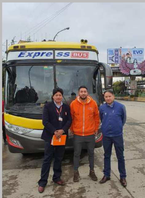
EJECUTIVOS DE BANCO ECOFUTURO.