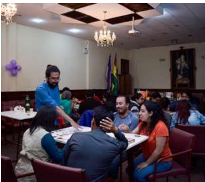
IS AM HIL IS DDOLORERE PERNATIA