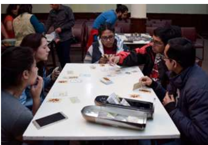
IS AM HIL IS DDOLORERE PERNATIA

Red Moon es una sociedad especializada en juegos de mesa que nace como un grupo de tiendas virtuales con el objetivo de expandir los juegos de mesa a distintos niveles y democratizar el acceso a los mismos. Recientemente se realizó un abierto de juegos de mesa, se trata de brindar un tiempo y espacio para poder mostrar los juegos a la comunidad de manera que se pueda encontrar a más personas con el mismo hobby y además el juego de su preferencia, a este evento, que se realizó en el auditorio de la Universidad Nuestra Señora de La Paz, asistieron en gran mayoría jóvenes, pero también personas mayores y niños.