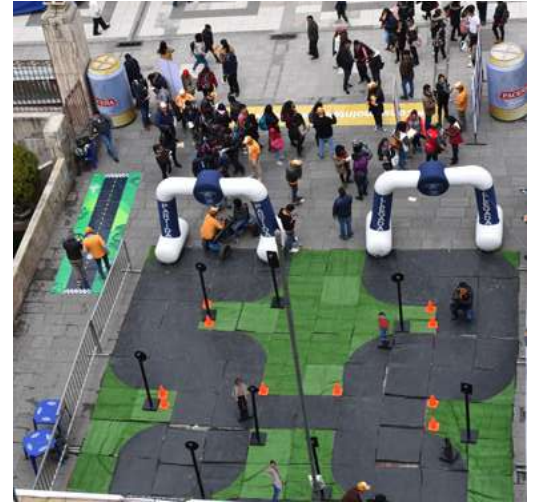
▲ Vista panorámica en el Atrio de la UMSA.

La iniciativa está enmarcada en el Día Mundial del Consumo Inteligente, que se celebra el 13 de septiembre, y cuenta con el apoyo de 200 voluntarios.